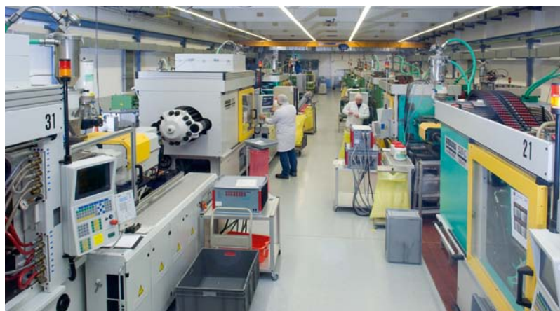
Unsere Produktionshalle am Standort Ansbach. Our production hall at Ansbach.