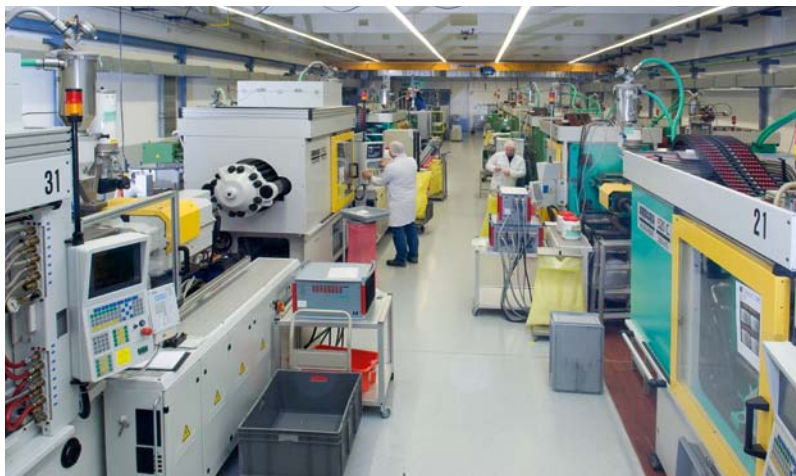
Am Produktionsstandort Ansbach sind wir für Sie tätig. We are active on your behalf on the production site in Ansbach.